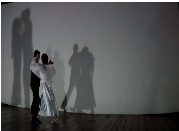
Internos de un psiquiátrico ruso ofrecen una función de baile a miembros del Ejército de la Federación Rusa.

va en materia de salud mental en su país, haciendo especial hincapié en la Ley 2716/99, que se refiere a la modernización y desarrollo de los servicios de salud mental de Grecia. “En la ley” –comentó– “se recoge que el Estado es directamente responsable de la protección de los derechos de las personas con enfermedad mental” . Papadopoulou destacó la activa participación de la sociedad civil griega, mediante diversas entidades que representan a usuarios de servicios de salud mental y sus familias, un observatorio nacional de los derechos de las personas con discapacidad mental, y dos representantes de ONG´s que son miembros del Comité Científico para la protección de los derechos humanos de personas con problemas mentales, dependiente del Ministerio de Sanidad griego. Respecto a las actuaciones de la Institución que representa, destacó que se han he-