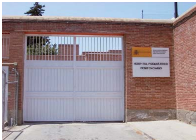
Hospital Psiquiátrico Penitenciario de Alicante.

y según datos que maneja el Ministerio de Sanidad “ el 9% de la población española padece un trastorno mental, y más del 15% lo padecerá a lo largo de su vida ”. Es un colectivo muy numeroso que, hasta hace relativamente poco, mostraba un panorama sombrío en cuanto a su atención sanitaria tanto en el plano normativo, como de coordinación entre administraciones, o incluso comunidades autónomas que carecían de planes de salud mental.